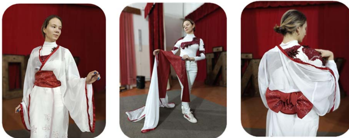
Образ «Образ по японской легенде о богине Идзанами»

III место – Творческая группа ГБПОУ Республики Марий Эл «Йошкар-Олинский техникум сервисных технологий», название образа «Цыганочка»;