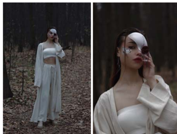
Образ «Источник творчества: творчество китайского художника Линь Лян. Династия Мин». Автор: Чернавина Валерия Игоревна, ГАПОУ «Колледж малого бизнеса и предпринимательства» г. Казань II место