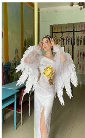
Образ «Светлый мир ангелов»