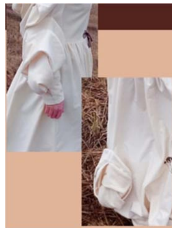
Образ «Мирей Де Ава»

Автор: Старцева Светлана Александровна , ГБПОУ Республики Марий Эл «Йошкар-Олинский технологический колледж»