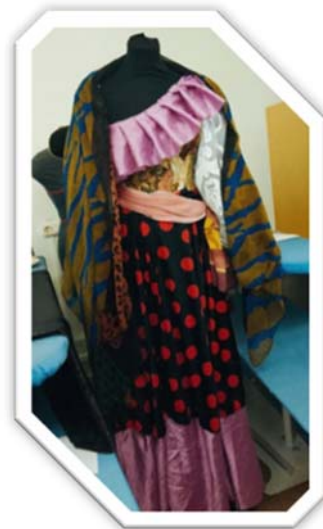
Образ «Цыганочка» Авторы: Творческая группа ГБПОУ Республики Марий Эл «Йошкар-Олинский техникум сервисных технологий» III место