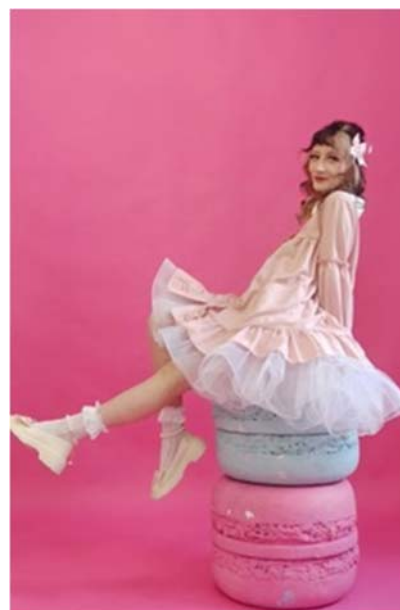
Образ «Японский Street style» Автор: Колпакова Варвара Александровна, КОГПОБУ «Кировский технологический колледж» I место