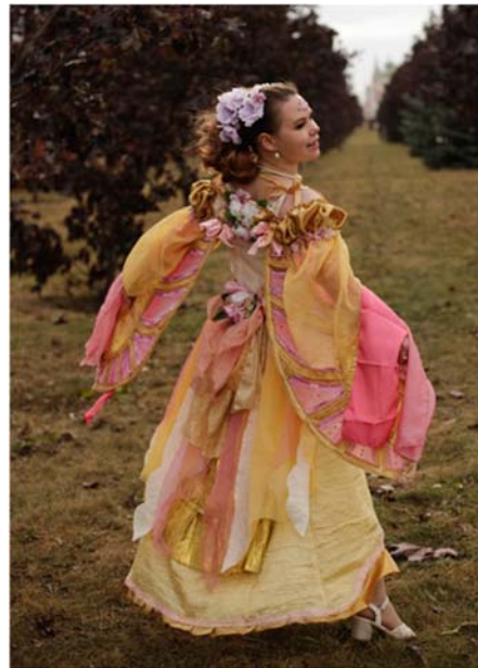
Образ «Королева фей»

Автор: Шабалина Светлана Викторовна , ГАУК Республики Марий Эл «Марийский театр юного зрителя»