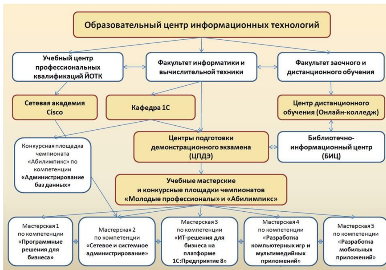
Рисунок 1. Схема структуры образовательного центра информационных

Создание Образовательного центра информационных технологий со структурными подразделениями, представленными на рисунке 1.